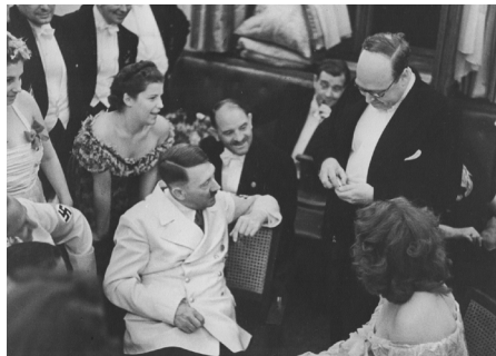
Kalanag zaubert vor Adolf Hitler.