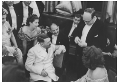
Kalanag zaubert vor Adolf Hitler.

Beginn des Zweiten Weltkriegs mit dem Angriff Nazi-Deutschlands auf Polen.