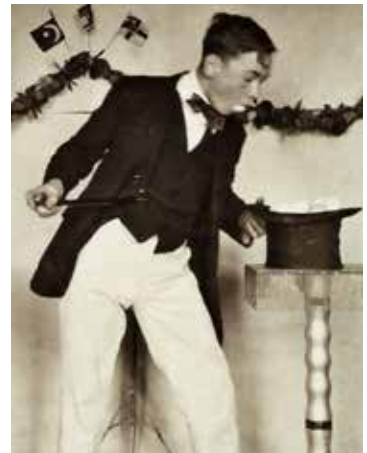
Kalanag zaubert seit seiner Jugend.