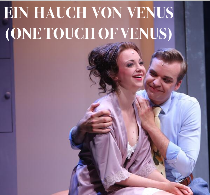
EIN HAUCH VON VENUS (ONE TOUCH OF VENUS)