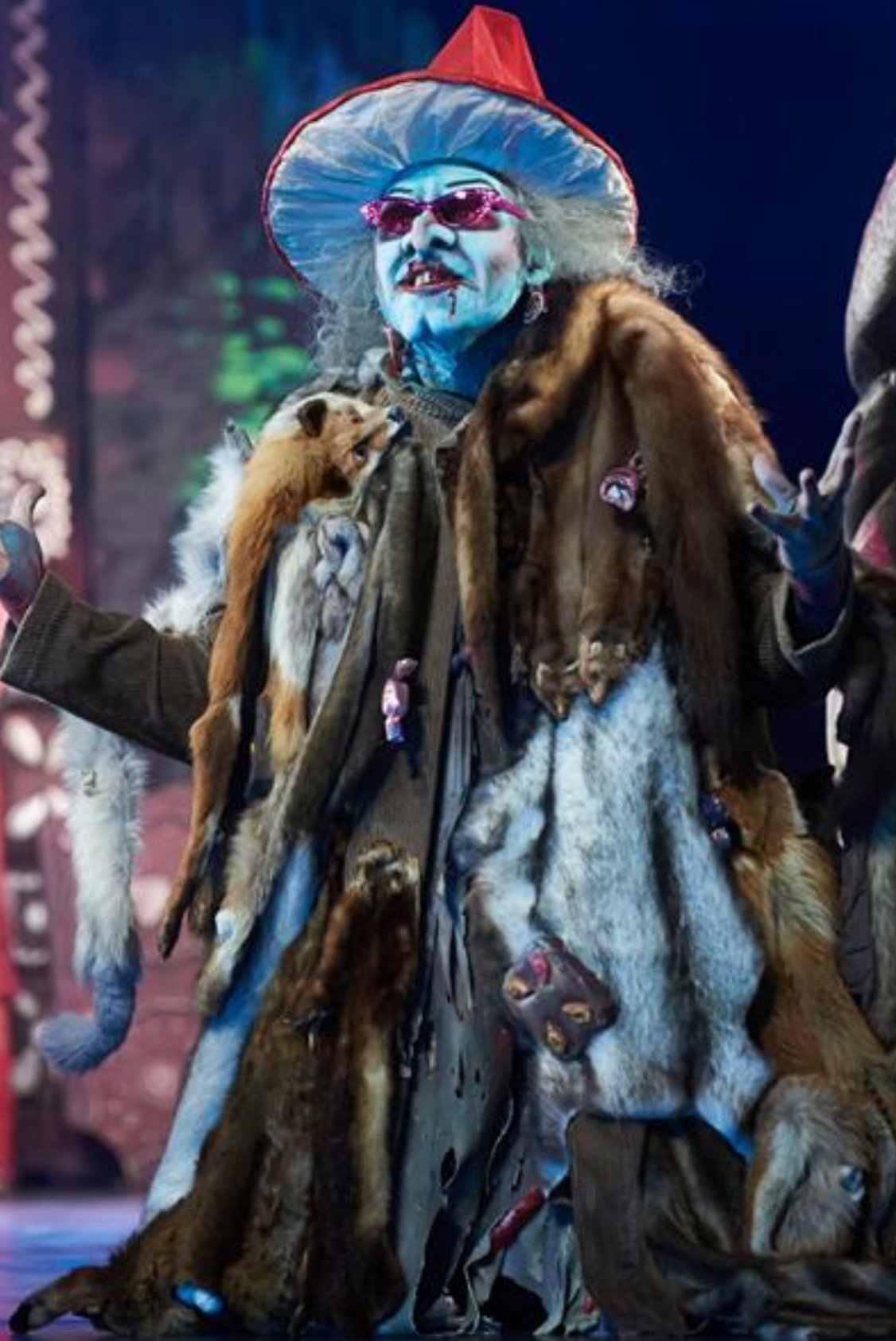
HÄNSEL UND GRETEL