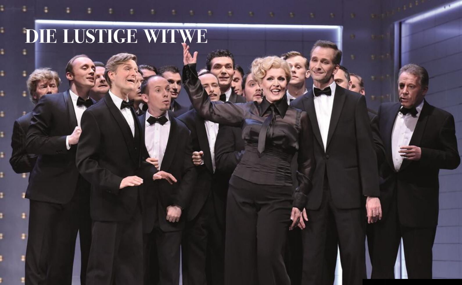
DIE LUSTIGE WITWE