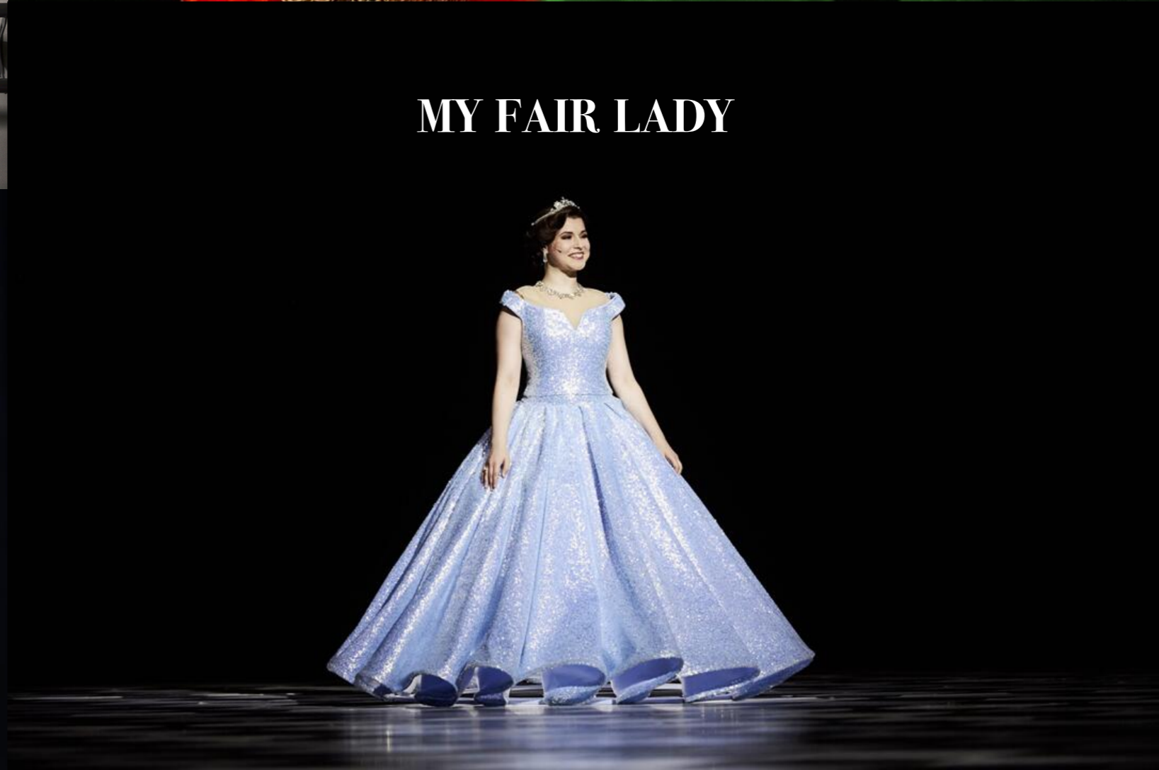
MY FAIR LADY