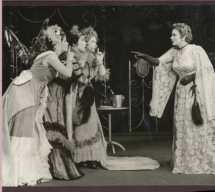
Pariser Leben (1866)