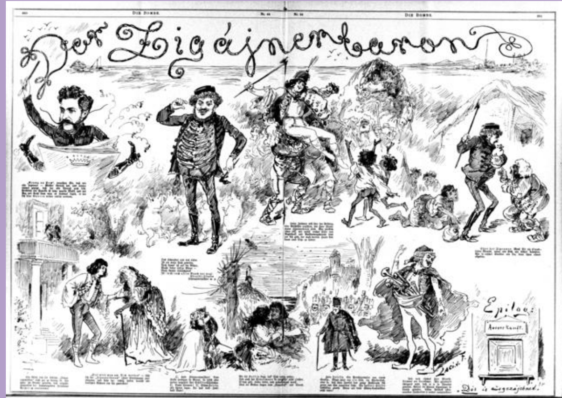
Der Zigeunerbaron (1885)