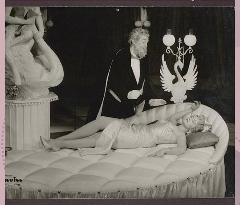
Die schöne Helena (1856)