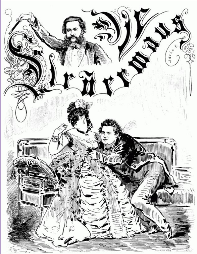
Die Fledermaus (1874)