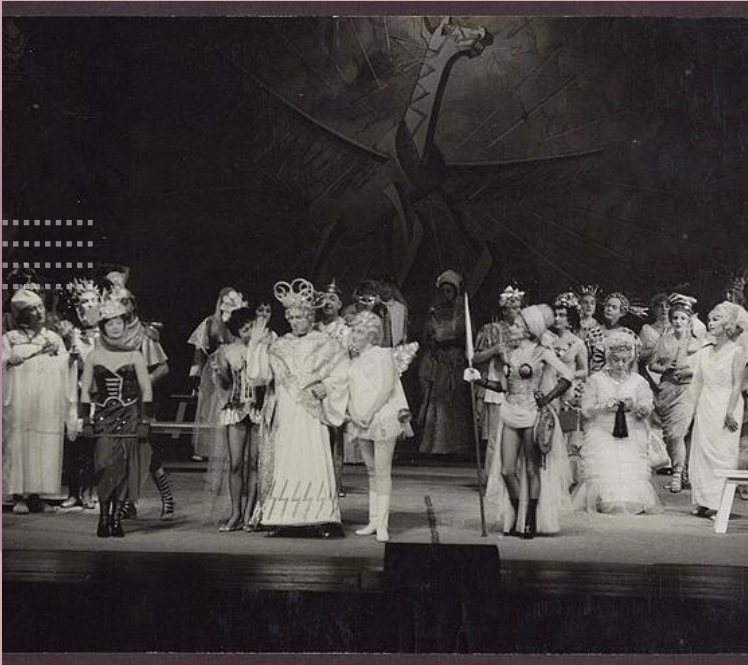
Orpheus in der Unterwelt (1848)